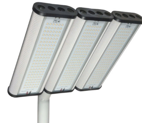
Рис. 1. Светильник «Модуль» консоль К-3, IP67.