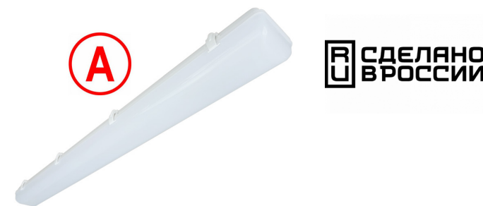
Рис. 1. Светильник «Айсберг», 38Вт, IP65.

Производитель оставляет за собой право вносить в конструкцию и комплектацию изделия технические изменения и усовершенствования, не ухудшающие технические характеристики изделия, в любое время и без предварительного уведомления.