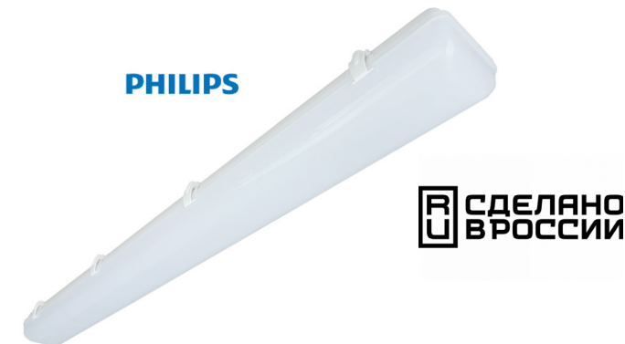
Рис. 1. Светильник «Айсберг» 1200мм, IP65.

Производитель оставляет за собой право вносить в конструкцию и комплектацию изделия технические изменения и усовершенствования, не ухудшающие технические характеристики изделия, в любое время и без предварительного уведомления.